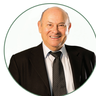
Marcel MARTEL Maire de Châteaurenard